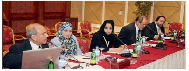
الملكى وعهد من الحضور