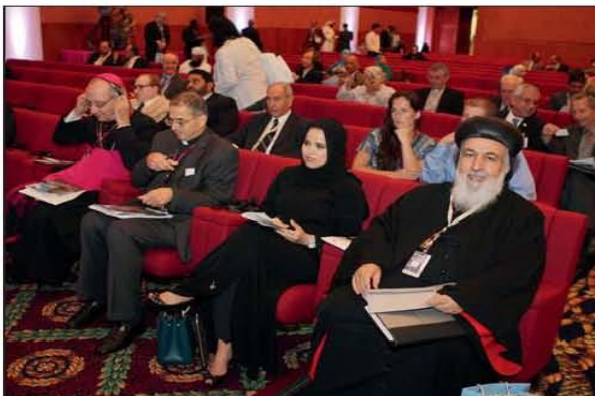
جانب من المحضور