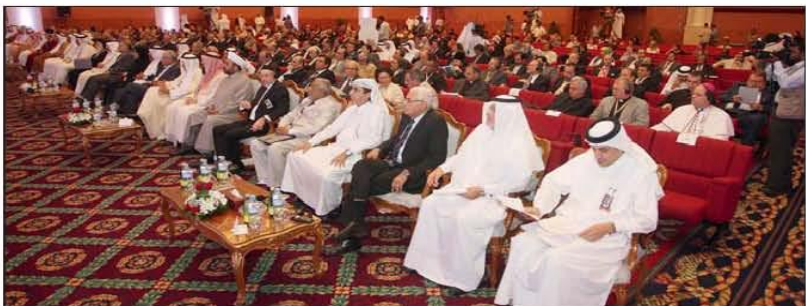
تصوير: اسامة فيصل خصم فرج الحضور